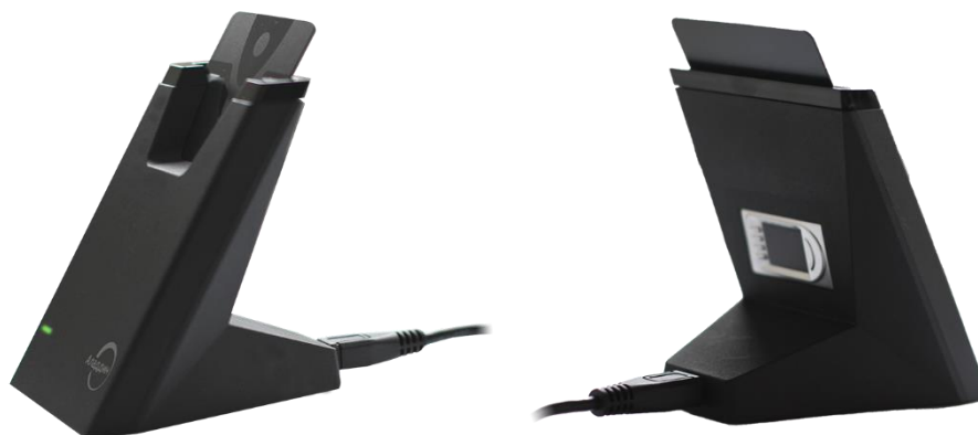
Рисунок 2 – Внешний вид смарт-карт ридера JCR781